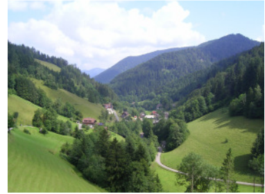
1. Abfahrt ins Wildgutach

Kurz nach St. Märgen geht es abwärts ins Simonswäldertal, genauer gesagt nach Wildgutach, dem oberen sehr schmalen Teil des Tales. Auf der anderen Talseite beginnt auch gleich der Anstieg nach Gütenbach. Es wird richtig steil. Wir fahren durch den Ort bis zum Sportplatz über dem Dorf. Hier stoßen wir auf die Marathonstrecke. Jetzt wird die Fahrt angenehmer. Es wechseln Anstiege, mit kurzen Abfahrten und Waldstücke mit freien Flächen. Der beeindruckende Blick ins Wildgutach am Hintereck macht deutlich, welches „Loch“ wir gerade durchfahren haben. Ein längerer Anstieg führt schließlich auf den Brend. Die Höhenmeter sind vorerst geschafft. Heute ist Zeit für einen Abstecher auf einem tricky Trail zu den mystischen Felsblöcken der Güntersfelsen mitten im Laubwald. Bei der Martinskapelle bewegen wir uns auf der Wasserscheide zwischen Nordsee und Schwarzem Meer. Kurz unter der Kapelle liegt die Donauquelle. Ein kleines Sträßchen führt eben weiter auf dem Höhenrücken bis zum Rohrhardsberg. Es wird anspruchsvoller. Auf dem Singletrail von der Yacher Höhe bis zum Hörnleberg kommt sich der Dreisamtäler vor, wie auf dem heimischen Kandelhöhenweg. Vom ersten Anblick völlig überrascht, stehen wir vor dem Hörnleberg mit der Wallfahrtskirche auf dem Gipfel. Jetzt darf man sich vom steilen Schlussanstieg nicht abschrecken lassen, denn oben wartet