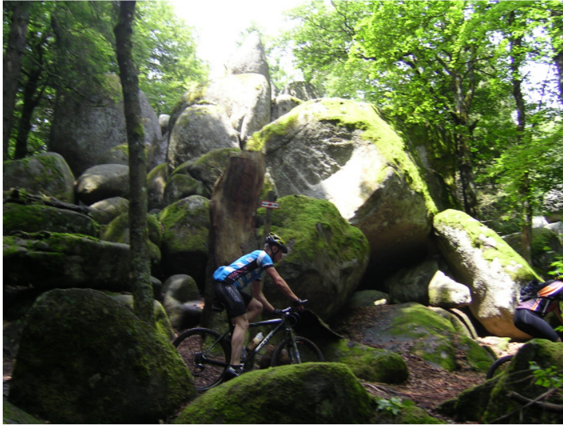
Traileinlage an den Güntersfelsen