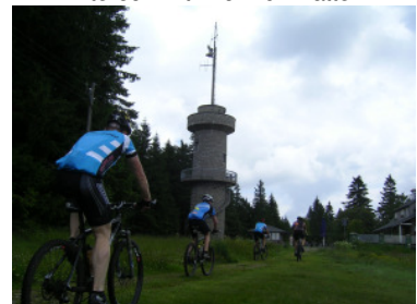
Auf dem Brend