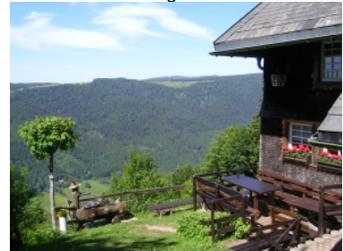
Am Hintereck mit Blick zur Platte