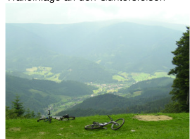
Startplatz für Gleitschirmflieger am Tafelbühl - Blick nach Simonswald