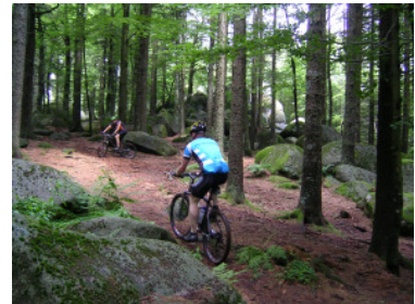
Traileinlage an den Güntersfelsen