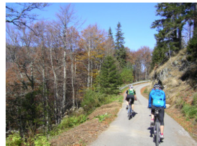
Zufahrtstraße zur Kunkelbachhütte

Bei der Fahrt über Saig nach Falkau versperrt uns eine tiefhängende Wolkendecke die Sicht in die Region um Lenzkirch. An diesem Zustand ändert sich auf unserer weiteren Fahrt bis zum Schluchsee nicht viel. Am Unterkrummenhof schaffen es dann die ersten Sonnenstrahlen durch die dünner werdende Wolkendecke. Auf angenehm zu fahrenden sandigen Forstwegen geht es durch Laubwälder über den Höhenrücken hinüber zur Verzweigung Bernau / Menzenschwand. Wir fahren ein kurzes Stück auf der Straße Richtung Bernau und steigen dann bei blauem Himmel und herrlichem Talblick auf dem Panoramaweg und später auf der asphaltierten Zufahrtstraße zur Kunkelbachhütte. Über die Almwiese und einen mit Laub bedeckten Forstweg geht es hinunter nach Menzenschwand. Beim Durchfahren und beim späteren Anstieg zum Zweiseenblick fasziniert uns der weitläufige Talabschluß von Menzenschwand. Vom Zweiseenblick haben wir dann eine ungetrübte Sicht auf den Ersten Streckenteil, denn wir am Morgen noch in Wolken eingehüllt zurückgelegt haben. Bei unserer nächsten Abfahrt queren wir die Feldbergpassstraße und steigen dann noch mal 200 hm bis zum Feldsee unserem letzten Tagesziel. Auf gewohntem Weg geht es dann über den Rinken und den Hinterwaldkopsattel nach Hause.