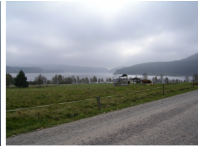
Die Wolkendecke über dem Schluchsee wird dünner