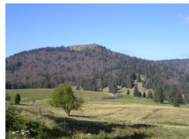
Blick von der Kunkelbachhütte zum Herzogshorn