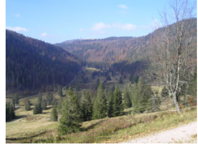
Talabschluss von Menzenschwand