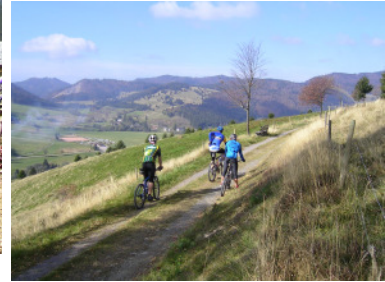
Panoramaweg über Bernau